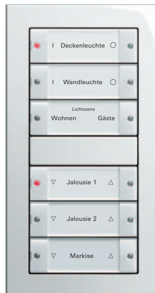
Die 2fach-, 4fach- und 6fach-Varianten werden mit einem 2fach-Rahmen ohne Mittelsteg kombiniert. Der Anschluss erfolgt über einen einzigen Bus-ankoppler.