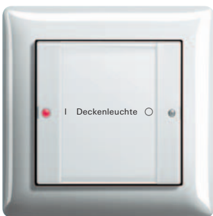
Der Gira Tastsensor 2 in den Varianten 1fach und 3fach ist erhältlich für die Gira Schalterprogramme Standard 55, E2, Event, Esprit, E22 und Flächenschalter.

Weitere Informationen erhalten Sie im Gira Katalog sowie im Internet unter www.gira.de