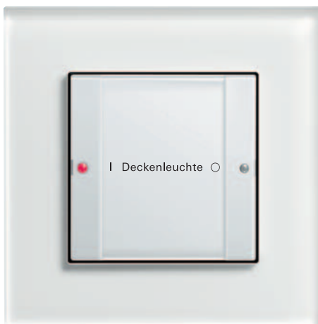
Gira Tastsensor 2, 1fach Gira Esprit Glas Weiß