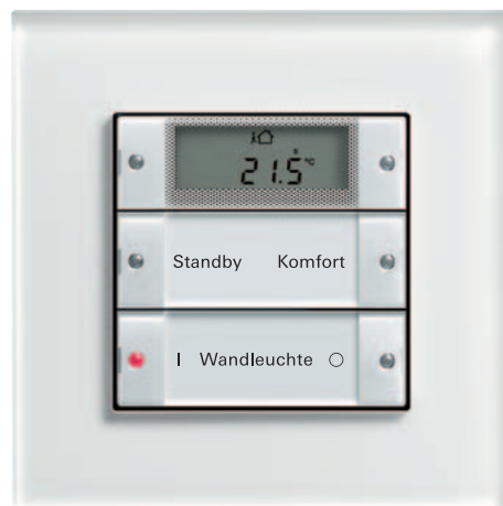
Gira Tastsensor 2plus, 2fach Gira Esprit Glas Weiß